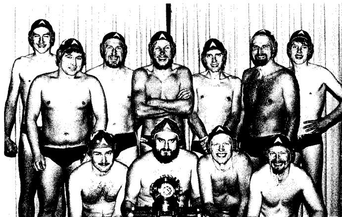
TritonCup søndag den 30/10 1983