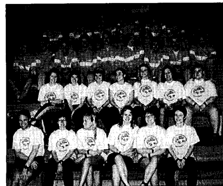
Dansk herre- og damelandshold i UV-rugby under nordiske mesterskaber i Finland 1993.