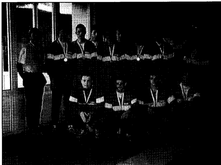
Det danske hold ved EM i uv-rugby for ungdom.

I weekenden 15.-16. januar 1993 startede så en ny samlingsrække med henblik på Nordisk Mesterskab i Sverige i efteråret 1993. Interessen for at få chancen for at komme på ungdomslandsholdet var overvældende. Mere end 50 unge spillere deltog i den første samling i '93. □