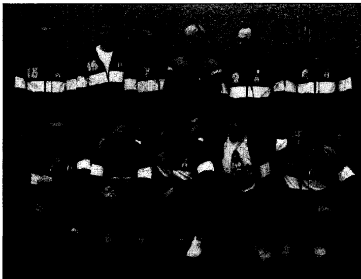
PI-dykkernes 1. hold i uv-rugby.

Turneringen, som foregik over 2 dage, gik planmæssigt og FS-Duisburg havde sørget for gode omklædnings- og opholdsforhold. Kampene blev spillet i et meget bredt bassin, 16 meter, mod normalt 12 meter, og der blev spillet 2×15 min. effektiv spilletid. Dommerne kunne der desværre ikke