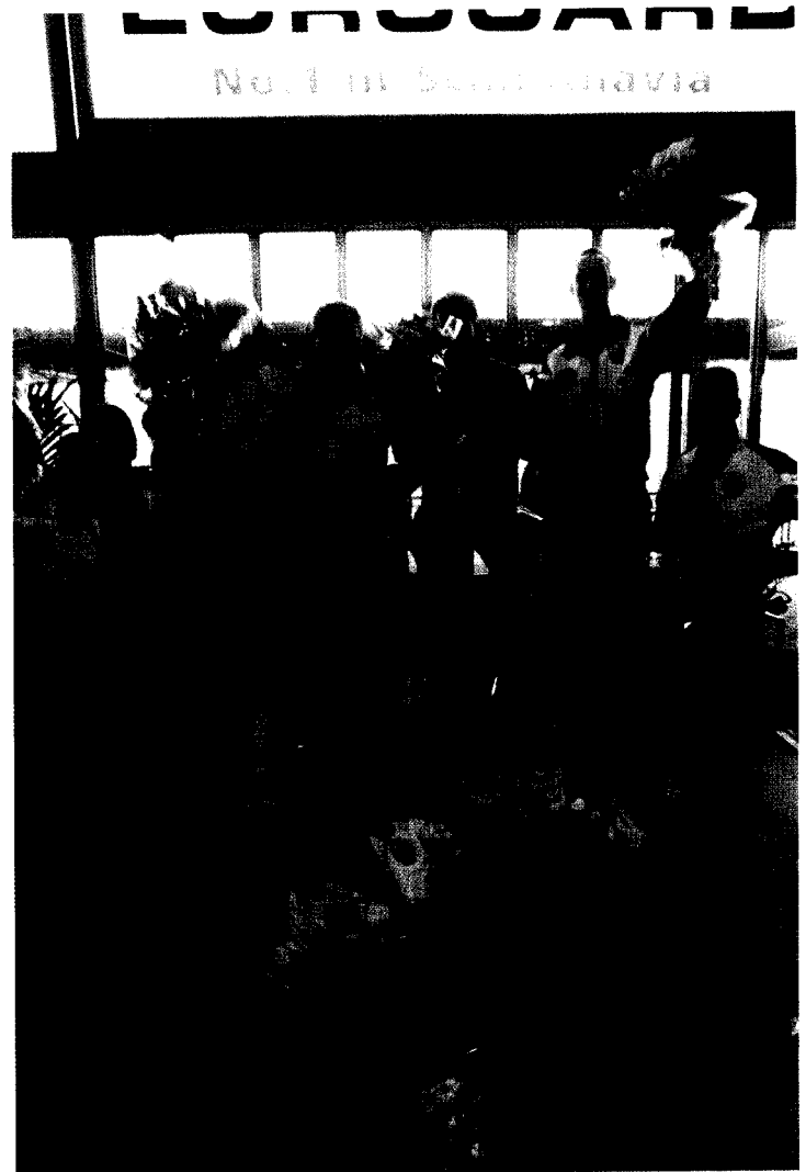
Hjemme igen. Blomster og varm velkomst.

At få et sådant arrangement til at klappe fra Danmark til Co-